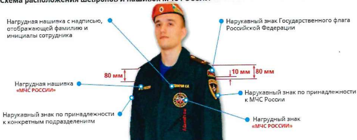
Схема расположения шевронов и нашивок МЧС РОССИИ