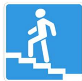
Надземный пешеходный переход